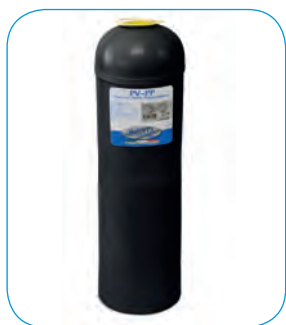
Bombola PV-PP. Pressure vessel PV-PP.