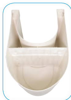
Versione a richiesta con paratia. On request version with partition grid.