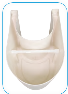
Versione standard. Standard version.